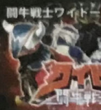
闘牛戦士ワイドー